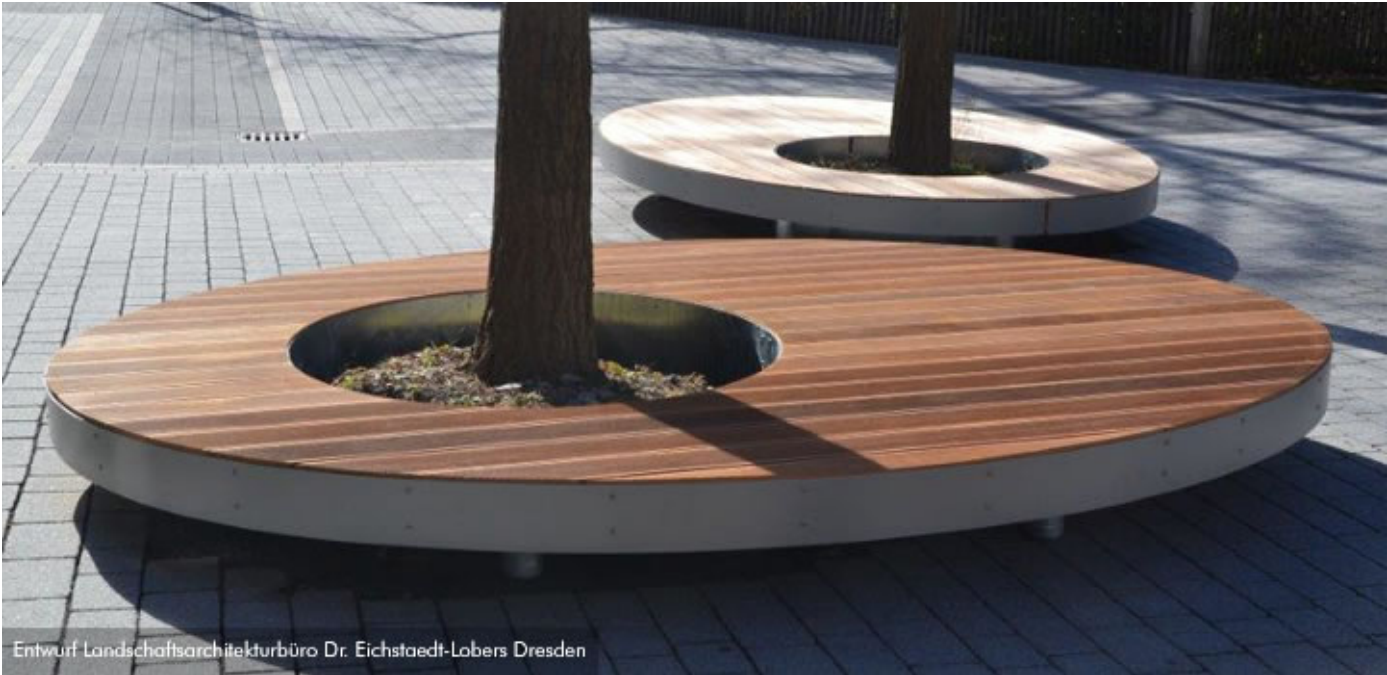
Entwurf Landschaftsarchitekturbüro Dr. Eichstaedt-Lobers Dresden